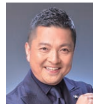
朝岡 聡 (ナビゲーター) Satoshi Asaoka

パリ国立高等音楽院を首席で卒業。2005年ルトスワフスキ国際チェロコンクール第1位他受賞多数。東京藝術大学音楽学部准教授。使用楽器はNPO法人イエロー・エンジェルより貸与されている1700年製ヨーゼフ・ゲアルネリ。