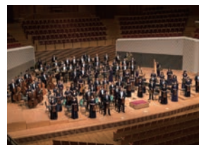
東京交響楽団 (管弦楽) Tokyo Symphony Orchestra

テレビ朝日アナウンサーとして活躍。フリーとなったからはクラシックコンサートの司会や企画構成にも活動のフィールドを広げ、芸術ファンのすそ野を広げる司会者として注目と信頼を集めている。