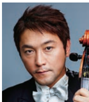
古川 展生 (チェロ) Nobuo Furukawa