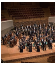
東京交響楽団 (管弦楽) Tokyo Symphony Orchestra

岡山市出身、ウィーン在住。ブラームス国際コンクール、日本音楽コンクール優勝。ウィーン楽友協会、ウィーン・コンツェルトハウス、ウィーン・フィルハーモニー管弦楽団のオーケストラアカデミーなどで数々のオペラやコンサートに出演し、プロ野球オールスターゲームにて国歌独唱を務めるなど、今注目の若手ソプラノ。五島記念文化賞オペラ新人賞、岡山芸術文化賞受賞。