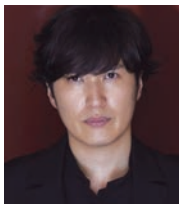
清塚 信也 (ピアノ) Shinya Kiyozuka